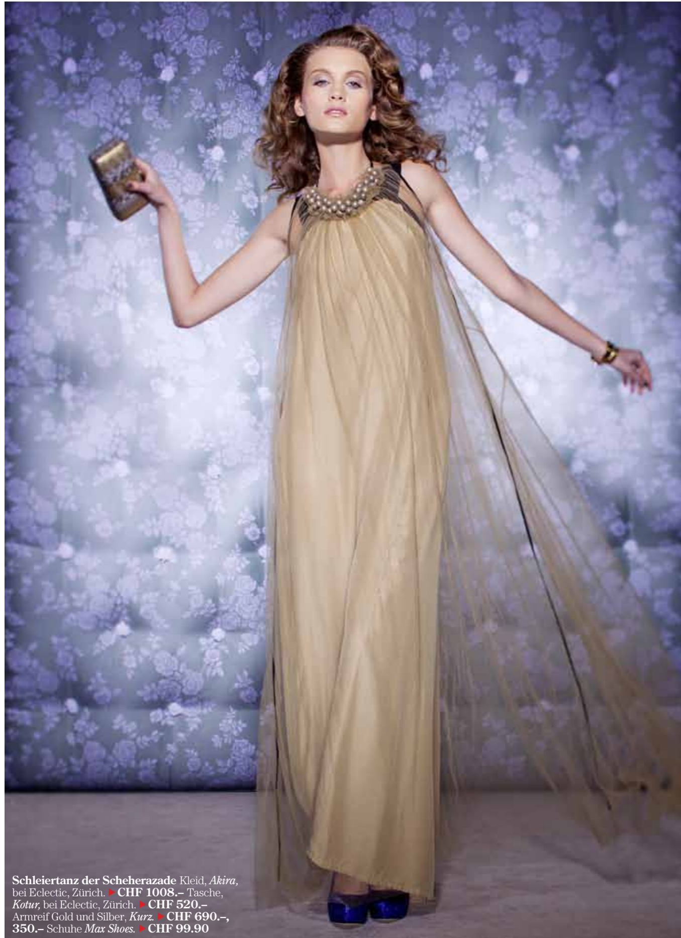
Schleiertanz der Scheherazade Kleid, Akira, bei Eclectic, Zürich. ▶ CHF 1008.- Tasche, Kotur, bei Eclectic, Zürich. ▶ CHF 520.- Armreif Gold und Silber, Kurz. ▶ CHF 690.-, 350.- Schuhe Max Shoes. ▶ CHF 99.90

«Spitzenstoffe zaubern einen Hauch Romantik herbei»